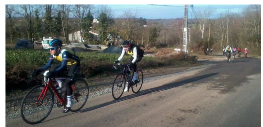
Séance force-vélocité à St Vincent sur Graon