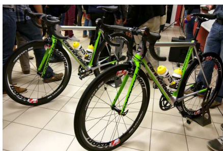
Les vélos 2017