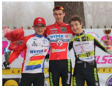
Triplé lors de la finale du Challenge Régional de cyclo-cross